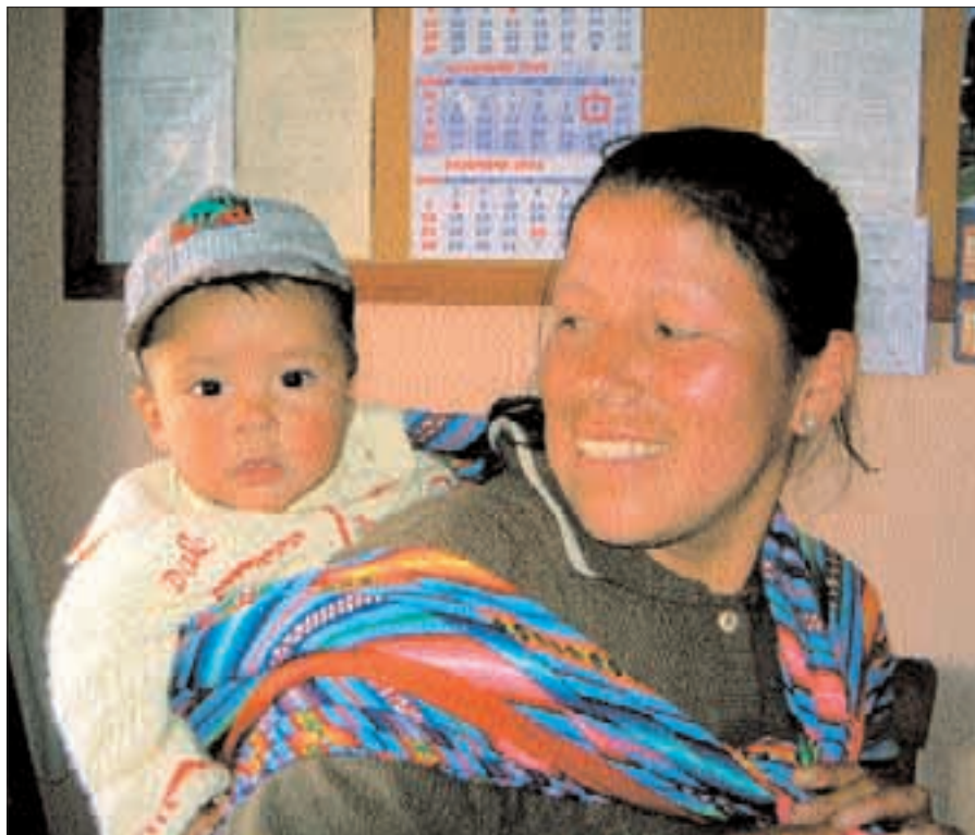
Krew Chrystusa daje nadzieję tej kobiecie z dzieckiem w La Oroya.

To w tym przytłaczającym kontekście, posługują Misjonarze Krwi Chrystusa. Często pytamy siebie samych: co powinniśmy powiedzieć biednym, którzy nie mają żadnej pracy ani zasobów, by zaspokoić podstawowe potrzeby jedzenia, zdrowia, edukacji i odzieży? Jak mamy im głosić Chrystusa? Co powinniśmy zrobić? Czasami nie możemy im nic powiedzieć, tylko im towarzyszymy stojąc solidarnie ich stronie.