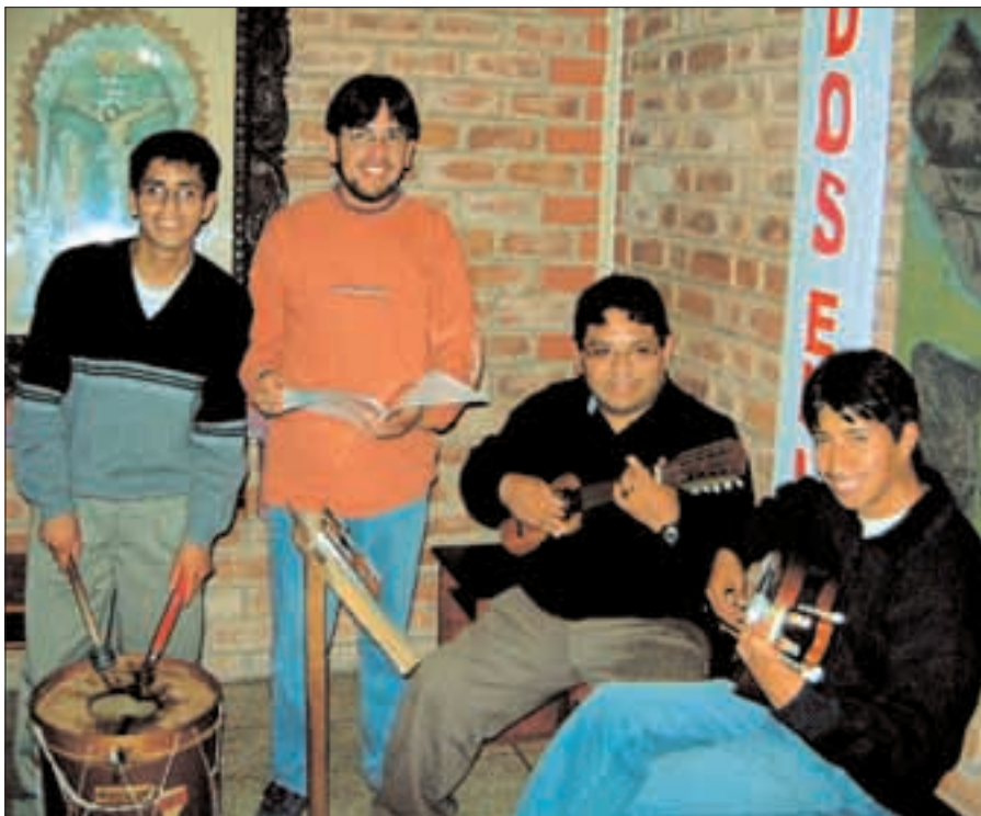
klerycy C.P.P.S. podczas Mszy św. w Domu formacyjnym św. Kaspra w Limie.

zyło te granice i jest teraz obecne w dwudziestu różnych kulturach i narodach świata. Te konteksty historyczne i kulturalne bardzo się różnią od tego, co doświadczał św. Kasper i pierwsi Misjonarze. Synowie św. Kaspra starali się pozostać wiernymi wcielając jego charyzmat w nowy i twórczy sposób w odpowiedzi na wciąż zmieniającą się sytuację.