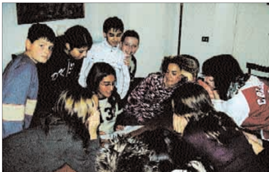
Ci młodzi z Rzymu odkrywają radość przyjaźni.

własne siły. Jezus jest tym, który kieruje. Jesteśmy tylko narzędziami w Jego ręku. świadomość, że można działać w pełnej komunii z Bożym planem zbawienia, napędza mnie radością, odnawia