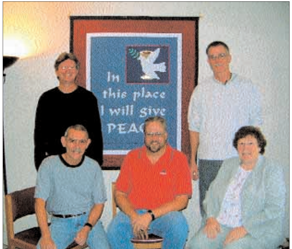
Grupa Pojednania Krwi Chrystusa w Chicago.