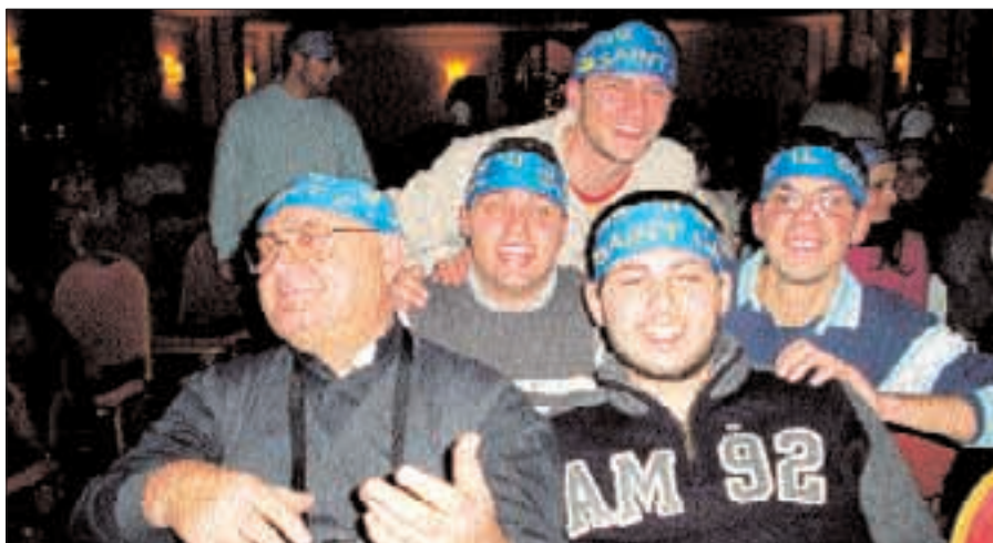
Święto młodzieży C.PPS w Fiuggi.

Nie bójcie się wchodzić w społeczeństwo, często pełne rekinów, wilków i wyzyskiwaczy. Nie zachwycajcie się ich drogami, walczyć po stronie najsłabszych. Bądźcie ludźmi miłości, nigdy nie opuszczającymi rąk. Pamiętajcie, że miłość jest zawsze silniejsza od nienawiści. Bądźcie światłem dla innych a stworzycie cywilizację miłości. To światło będzie świeciło nad wami i tymi, których uda się wam zaangażować. Będziecie wojownikami Miłości i Nadziei. Nie ma piękniejszej walki. ♦