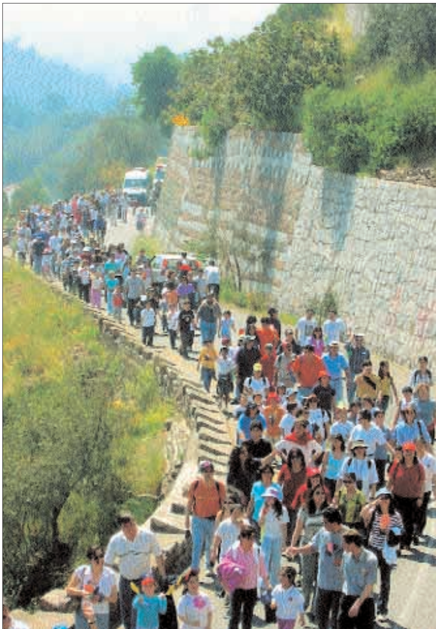
Grupy modlitwy i przyjaźni podczas pielgrzymki.

Ta działalność pomogła nie tylko ludziom z Icalma i okolicy, ale przyczyniła się bardzo do formowania młodych ludzi, którzy podczas każdej akcji misyjnej doświadczają bycia społecznie użytecznym, napędzają swoje serca miłością i solidarnością z innymi, nawiązują przyjaźnie pomiędzy sobą i z profesorami oraz Misjonarzami uczestniczącymi w ekipach.