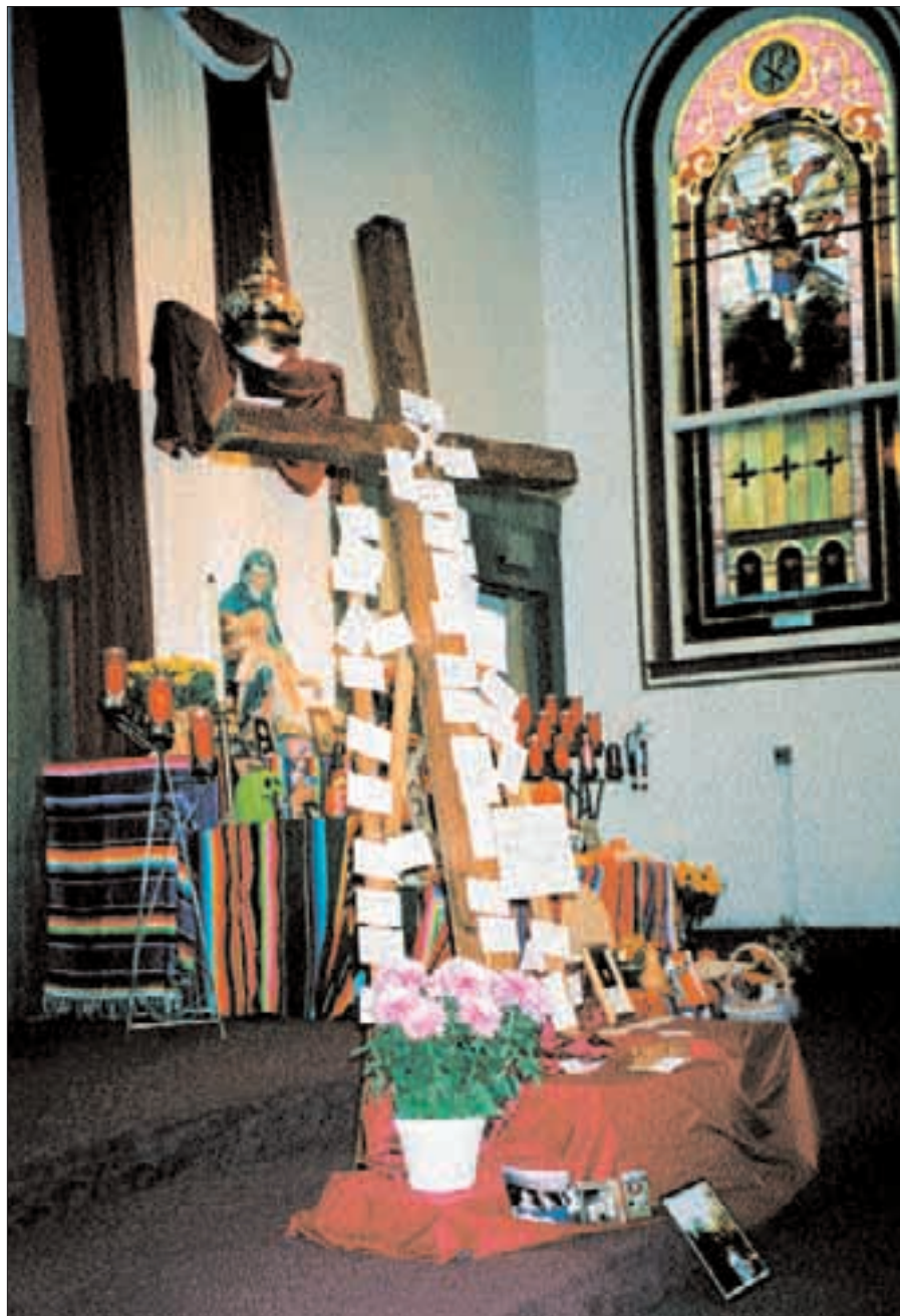
Ten krzyż modlitewny upamiętnia ofiary przemocy.

przez Północno-zachodni Uniwersytet w Chicago i zasponsorowany przez Archidiecezjalne Biuro Pojednania.